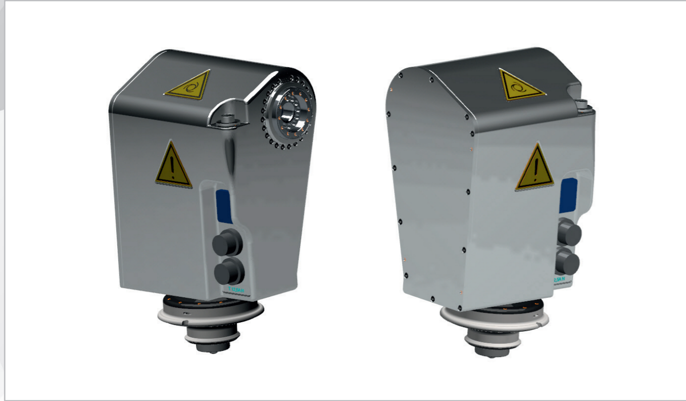
Pan- and Tilt-Einheit auf Basis des Aktuators AlopexDrive